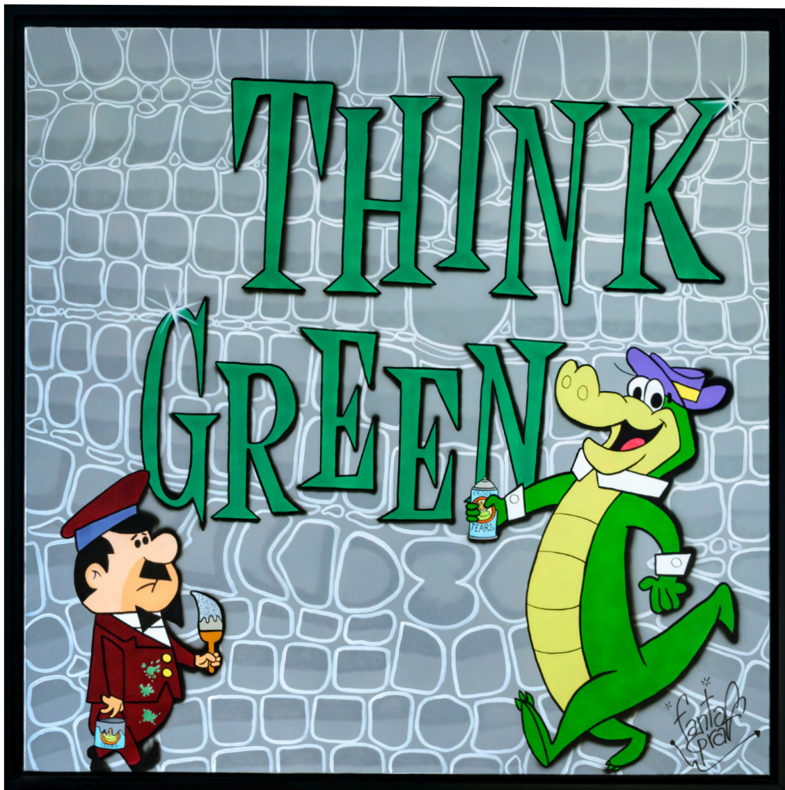
THINK GREEN Acrylique sur toile 100 X 100 cm