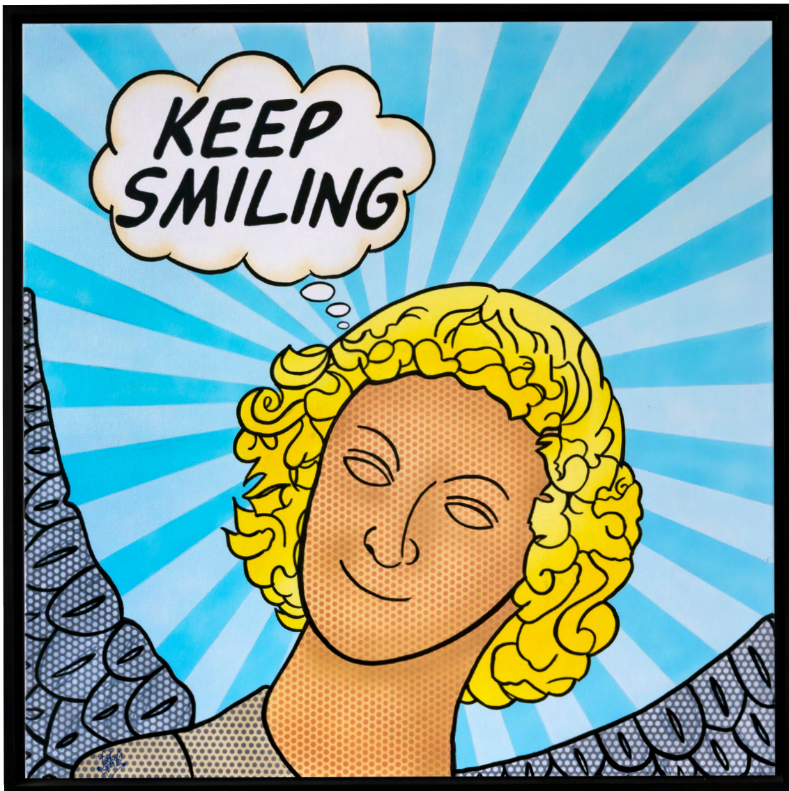
ANGEL feat ROY Acrylique sur toile 60 X 60 cm