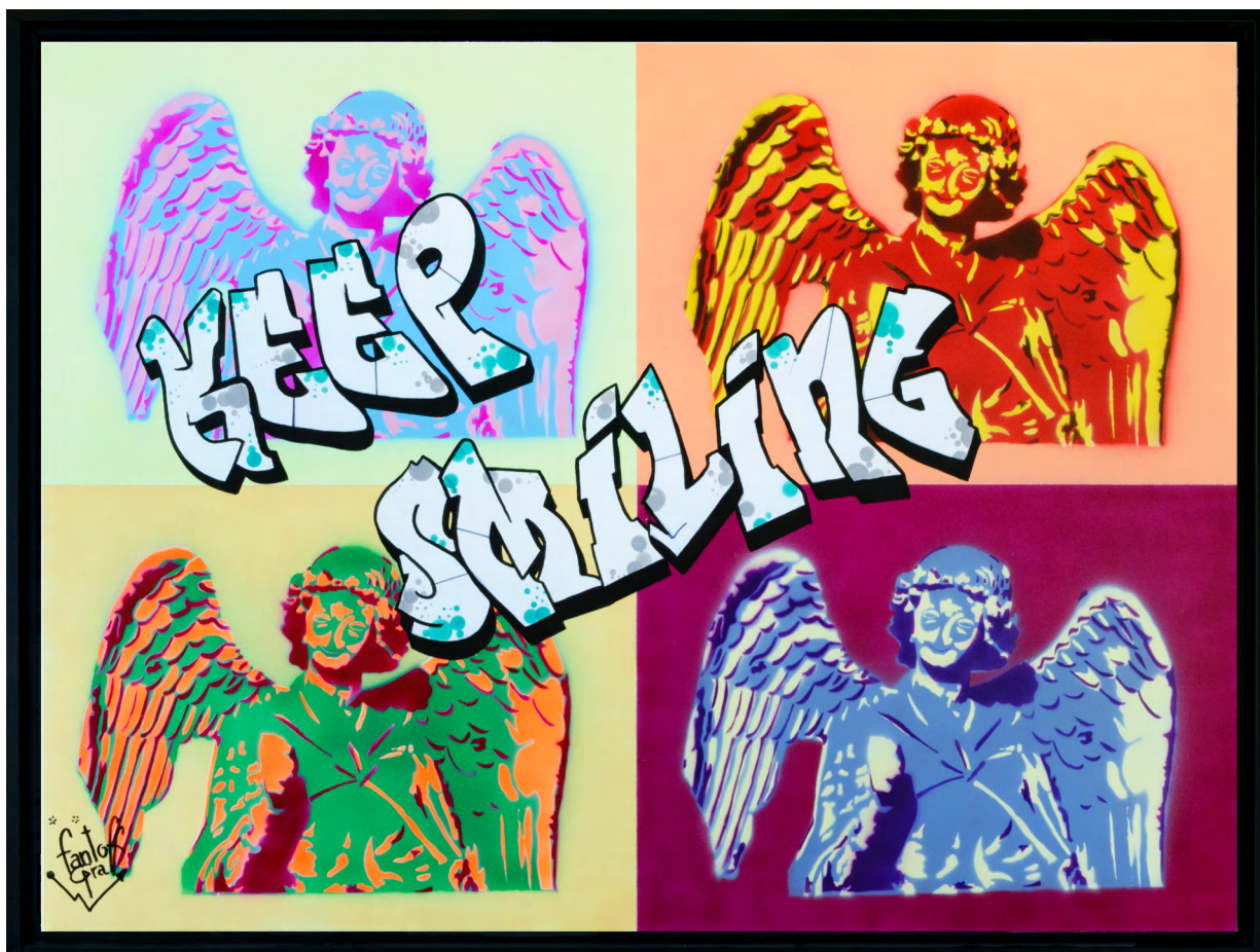
ANGEL feat ANDY Acrylique sur toile 80 X 60 cm