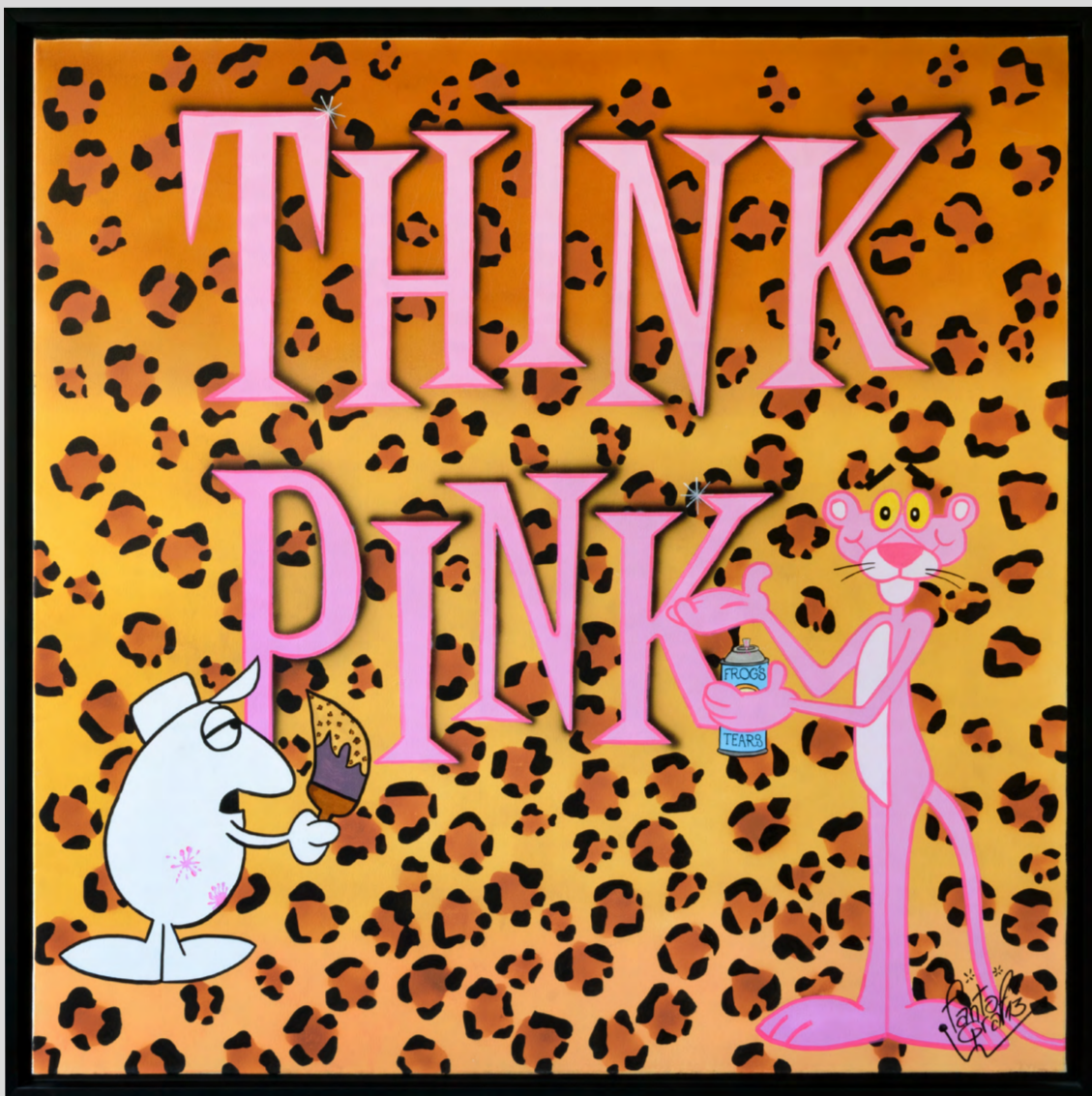
THINK PINK Acrylique sur toile 100 X 100 cm