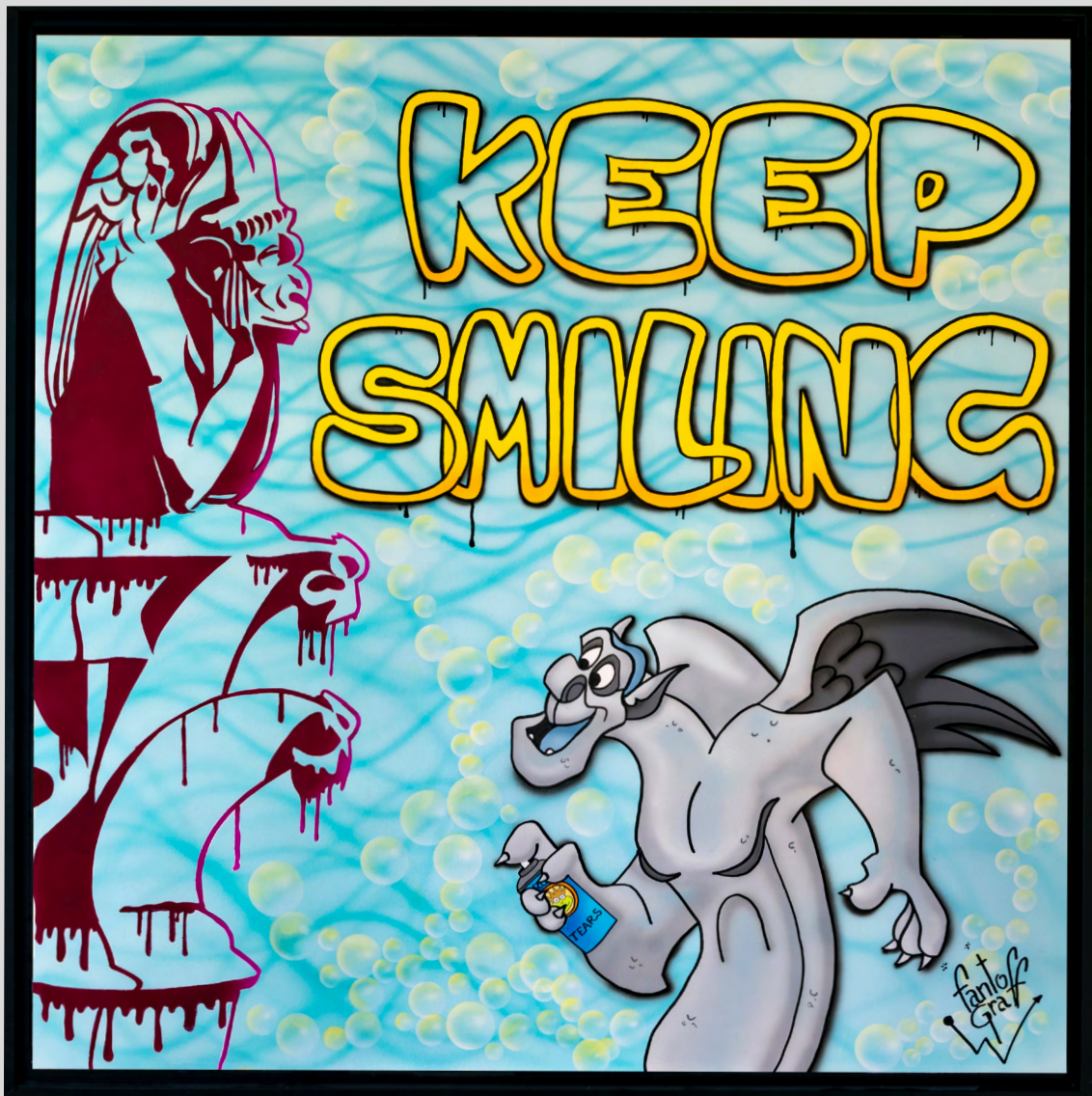
SPARKLING GRAFF Acrylique sur toile 100 X 100 cm