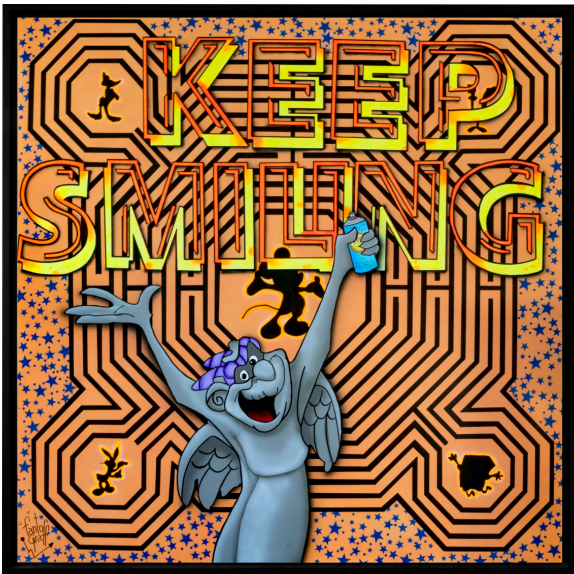
LABYRINTH Acrylique sur toile 100 X 100 cm