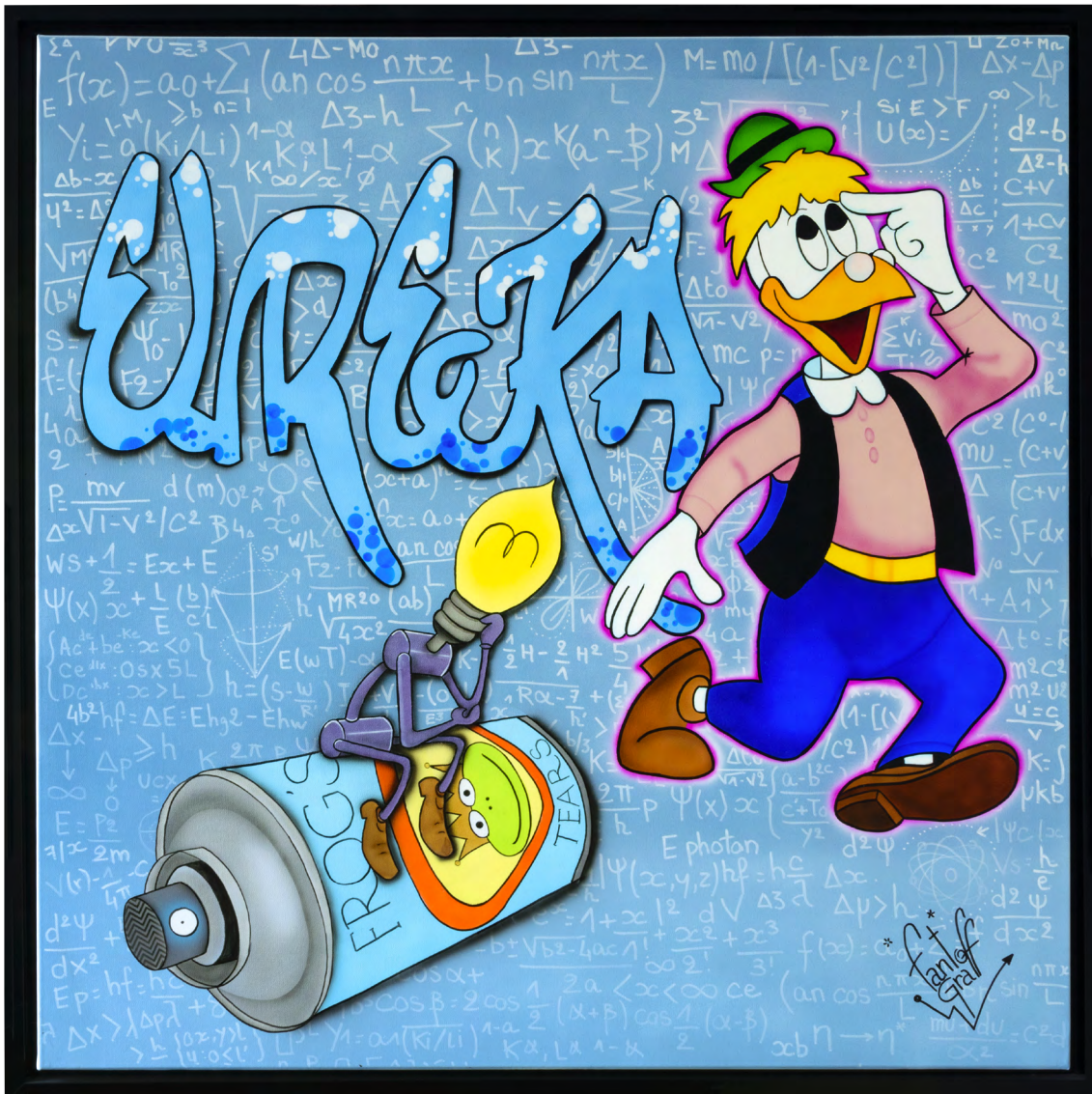
EUREKA Acrylique sur toile 100 X 100 cm