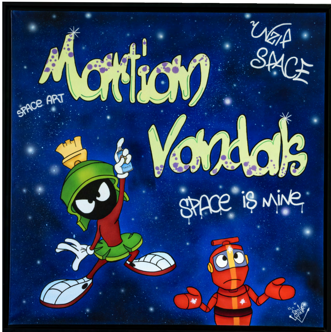
MARTIAN VANDALS Acrylique sur toile 100 X 100 cm