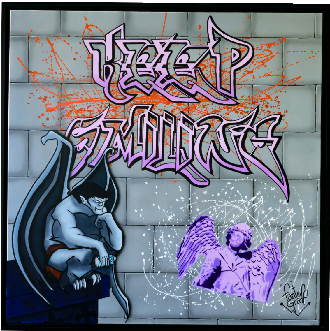
DARK SMILE Acrylique sur toile 100 X 100 cm