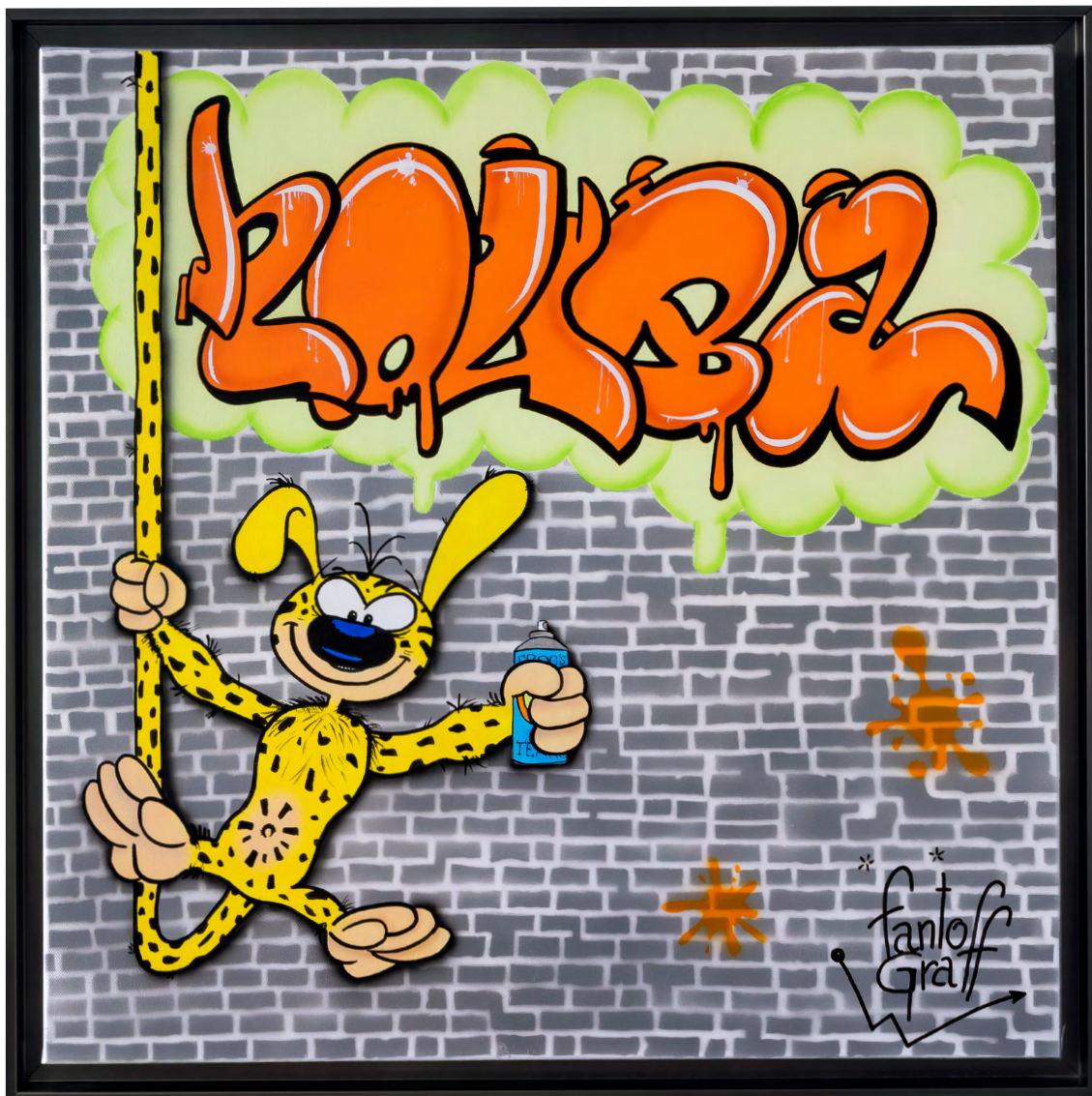
HOUBA Acrylique sur toile 60 X 60 cm