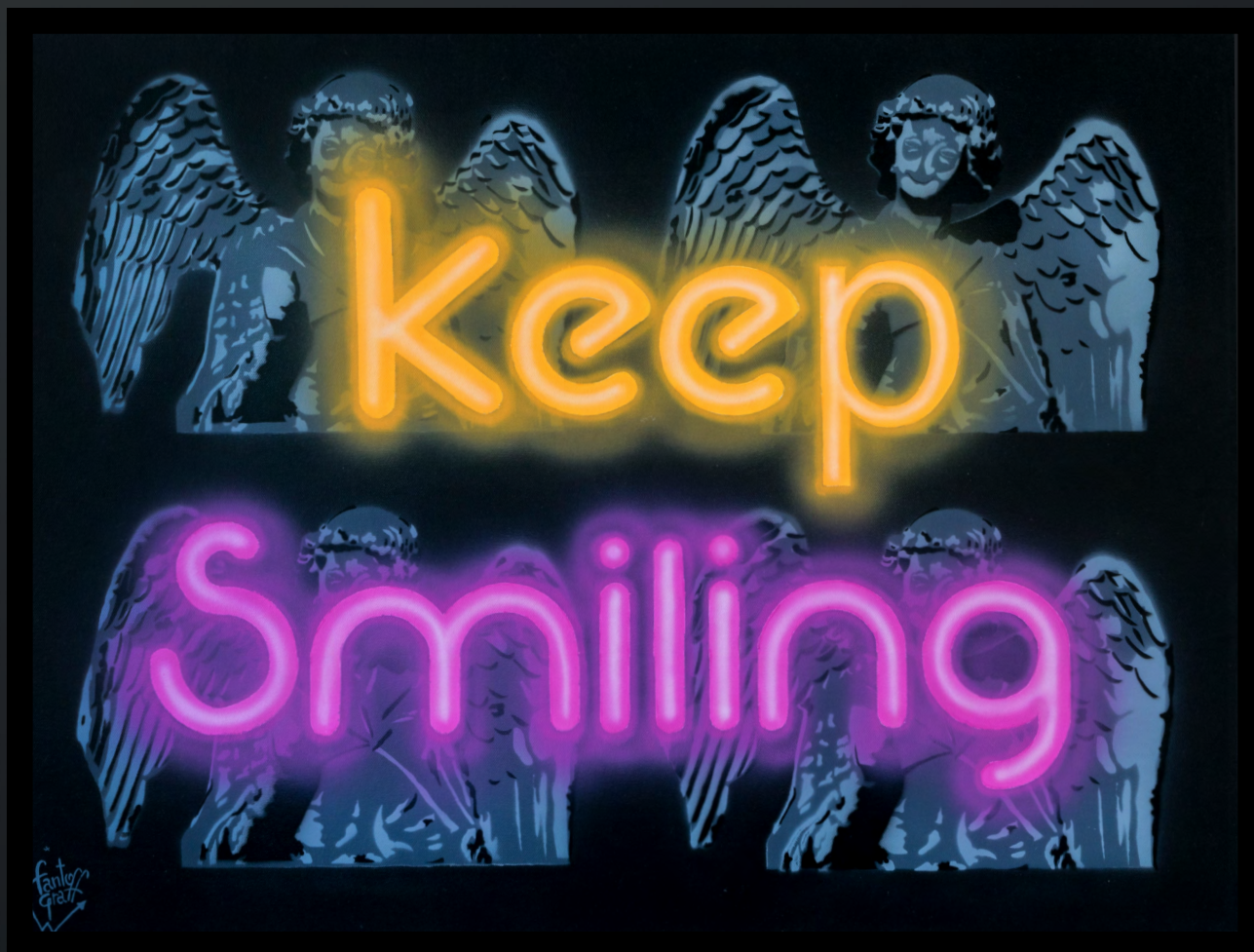
URBAN ANGEL Huile sur toile 80x60 cm