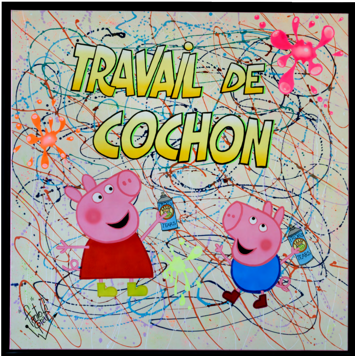
TRAVAIL DE COCHON Acrylique sur toile 100 X 100 cm