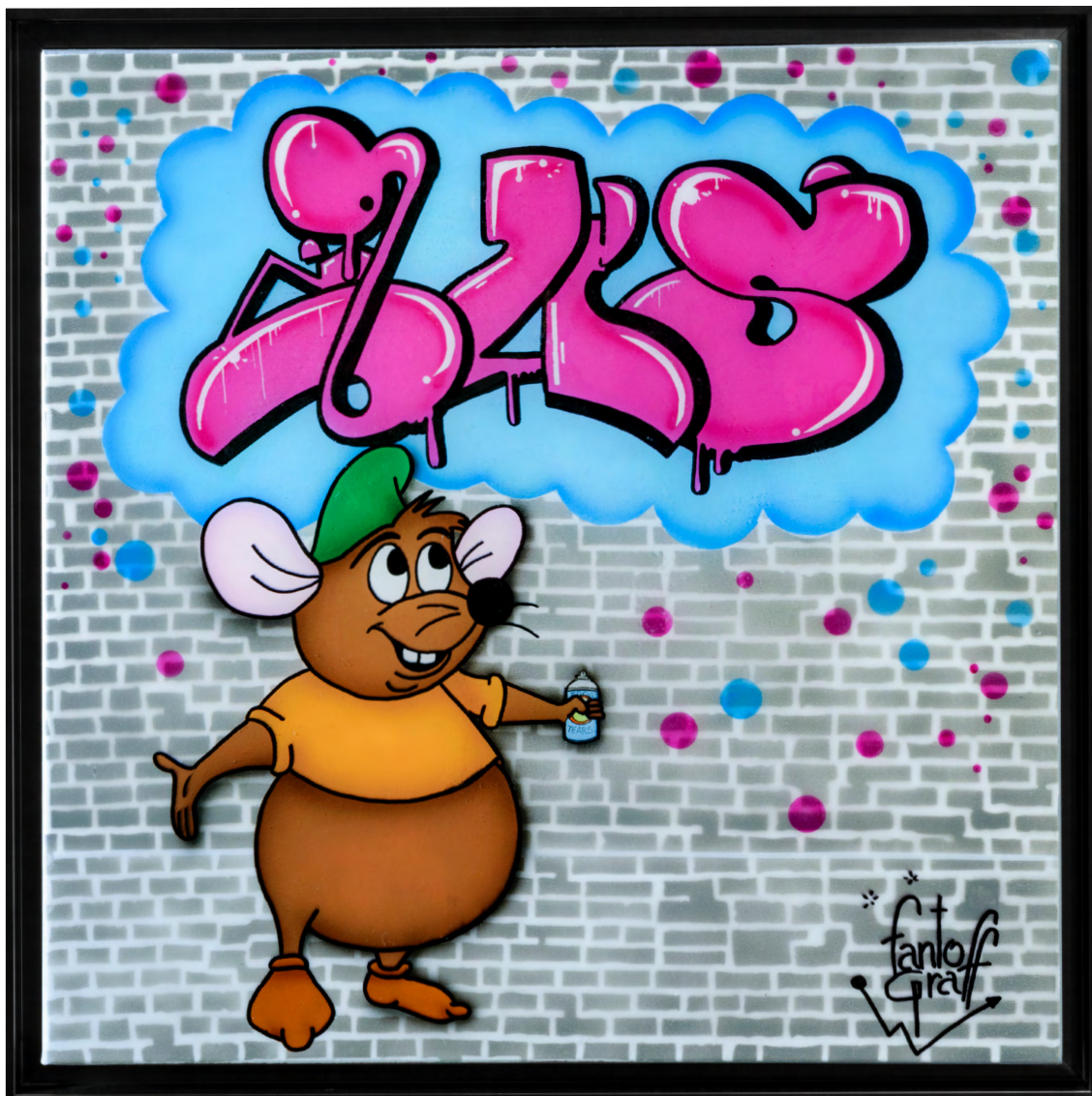
GUS Acrylique sur toile 60 X 60 cm