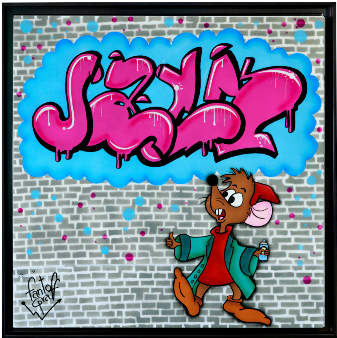
JACK Acrylique sur toile 60 X 60 cm