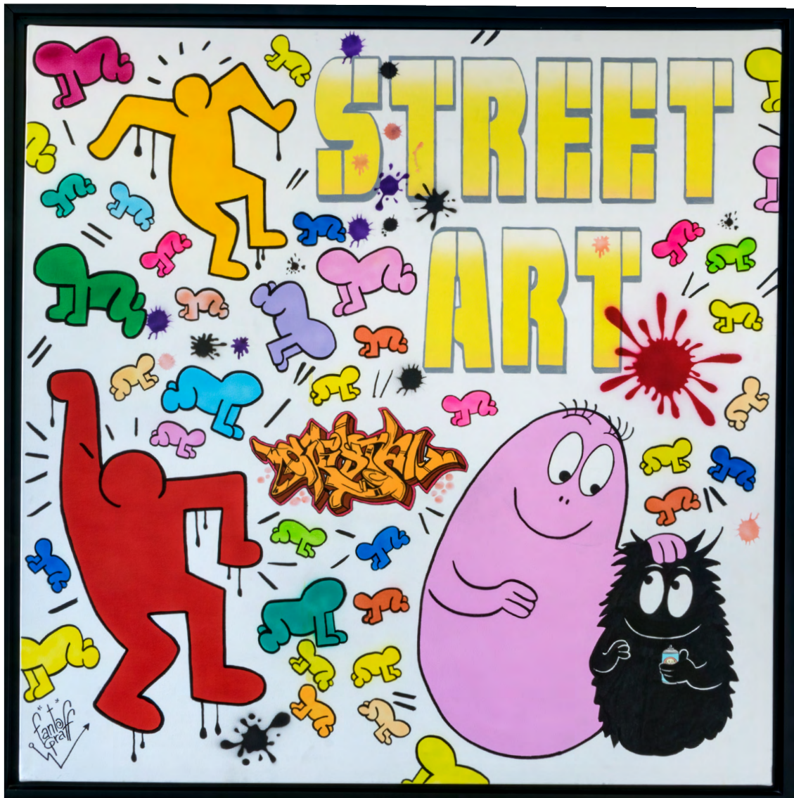
BARBAKEITH Acrylique sur toile 100 X 100 cm