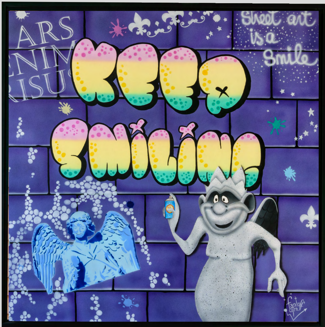
KING GRAFF Acrylique sur toile 100 X 100 cm