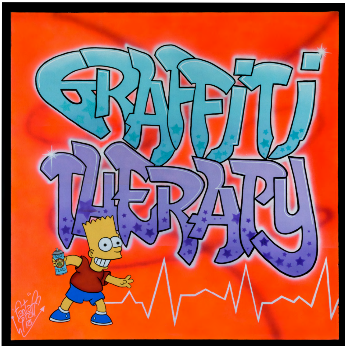
BART'S THERAPY Acrylique sur toile 100 X 100 cm