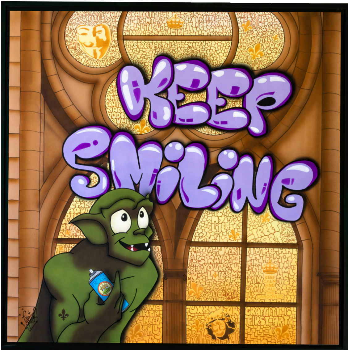
VITROGRAFF Acrylique sur toile 100 X 100 cm