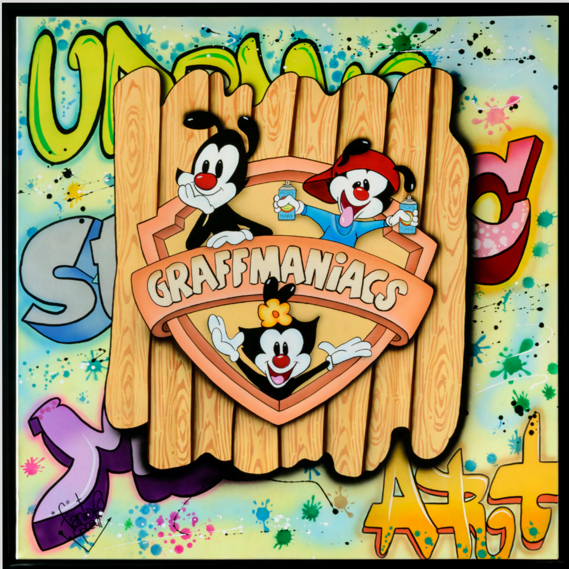
GRAFFMANIACS Acrylique sur toile 100 X 100 cm