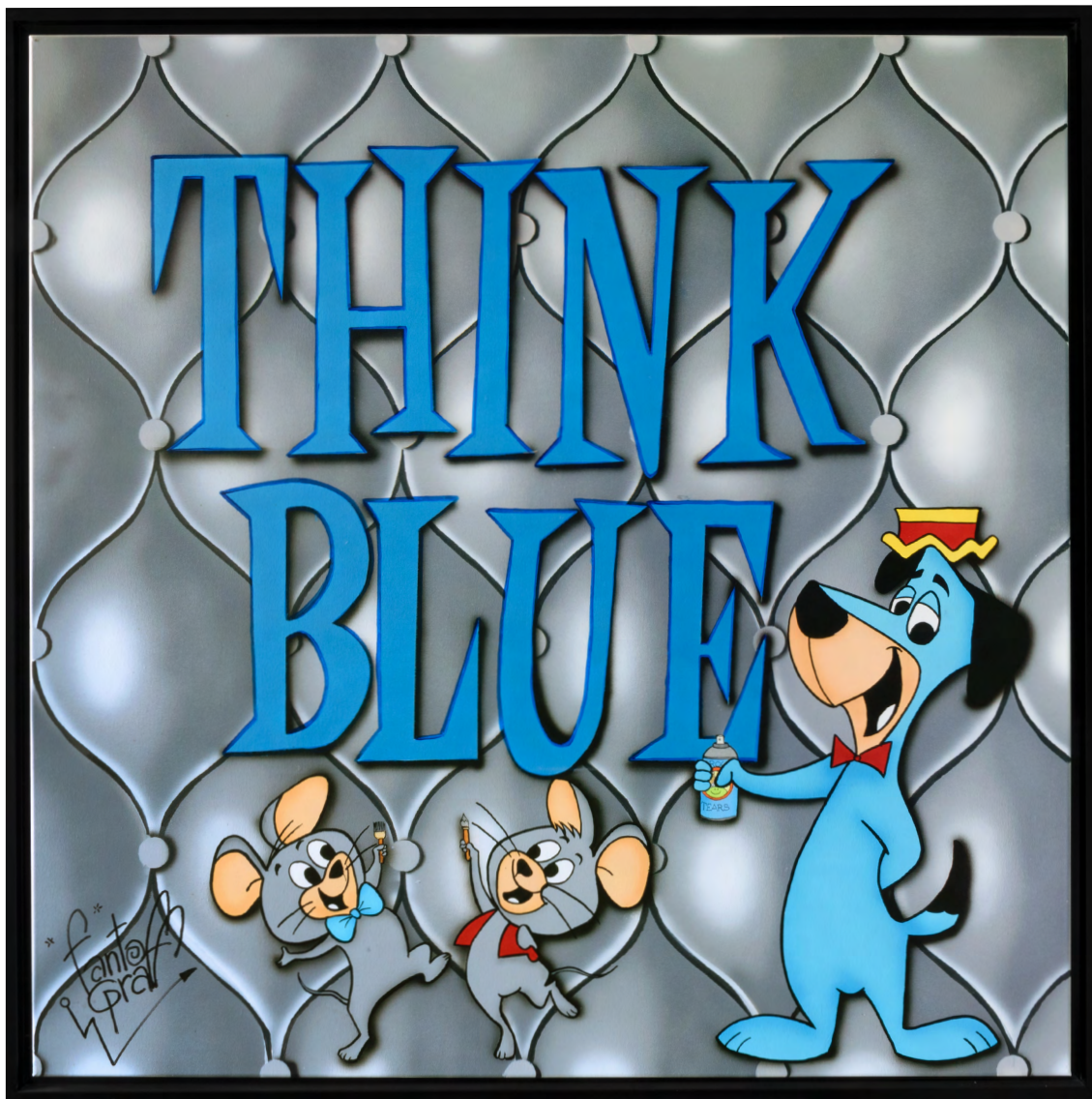
THINK BLUE Acrylique sur toile 100 X 100 cm