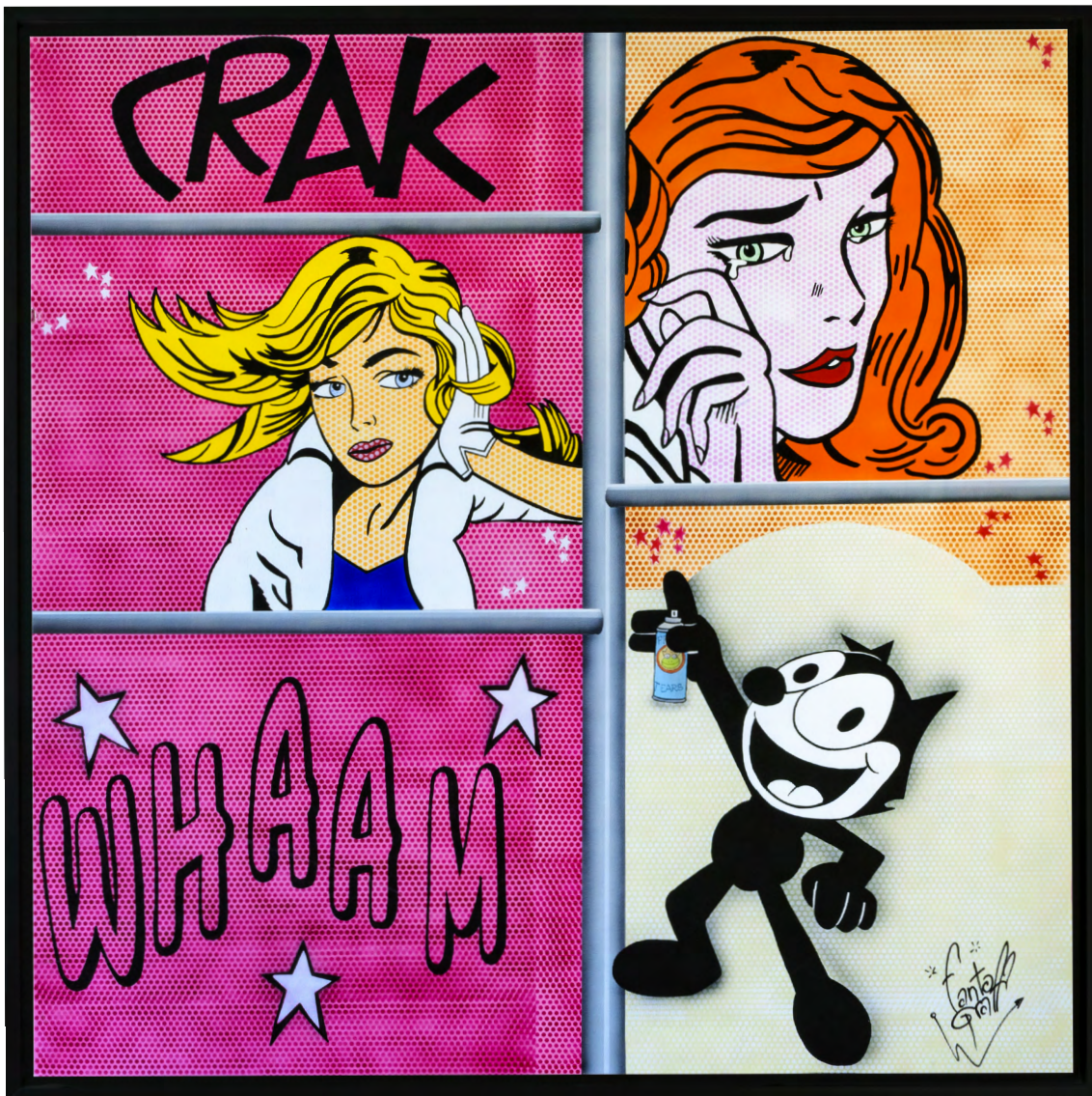
FELIX & ROY Acrylique sur toile 100 X 100 cm