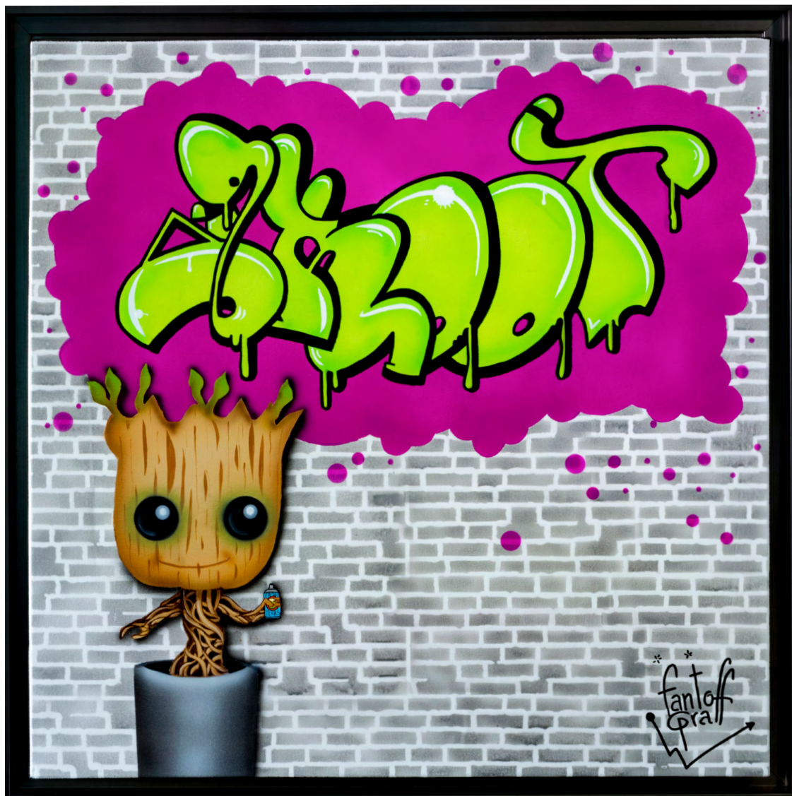
GROOT Acrylique sur toile 60 X 60 cm