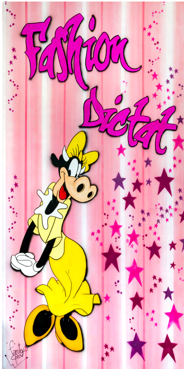
FASHION DICTAT Acrylique sur toile 200 X 100 cm